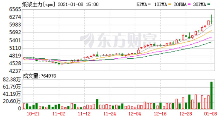
图：纸浆期货主力合约 SP2103 行情走势