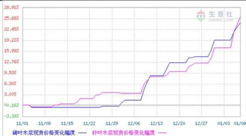
图：2020年11月至今阔叶木浆、针叶木浆价格趋势比较