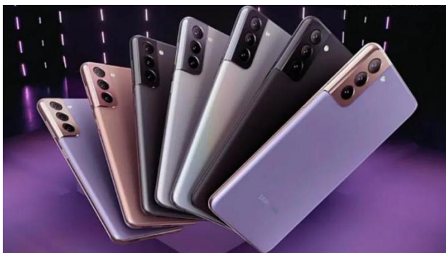
图 2: Galaxy S21 系列全部配色