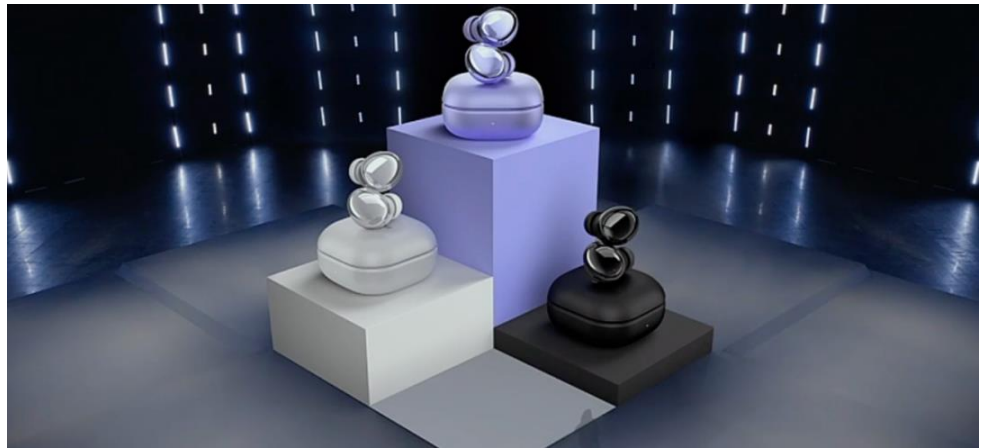
图 6: Buds Pro 及充电盒外观图

除 Galaxy S21 系列外，三星更新了 Galaxy Buds 产品线，推出了 Pro 版本。新款 Buds Pro 的外观与 Buds+相似，而且都采用入耳式设计，但整体看上去会更加小巧。而 Buds Pro 充电盒的外观则与 Buds Live 的圆润的方形翻盖式设计相似。三星提供了三种配色可供用户选择，分别是梵梦紫、幽夜黑和幻境银，售价为 199.99 美元（约合人民币 1295 元）。