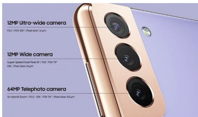
图 4：S21/S21+ 后置三摄

在相机方面，S21/S21+ 采用后置三摄方案，S21 Ultra 后置配备 4 枚镜头：S21/S21+ 的后置三摄方案为 64MP 光圈主摄+12MP 长焦+12MP 超广角镜头，前置为 10MP 单摄。而 S21 Ultra 则是后置配备了 4 枚镜头，外加一个激光模块，包括 108MP 主摄、12MP 超广角、10MP 长焦（支持 3 倍变焦）、10MP 长焦（支持 10 倍潜望式变焦），以及激光辅助对焦模块。三星表示，两款机型支持最高可达 30 倍的超分辨率变焦和空间变焦，新增的 Zoom Lock 防抖功能，使得 Galaxy S21/S21+ 可以最高录制 8K 24 FPS 视频。