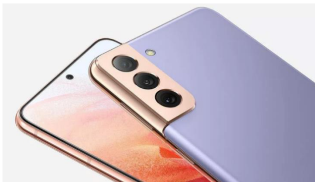
图 1: 梵梦紫配色撞色设计

在外观方面，Galaxy S21 系列加入撞色拼接设计。通常情况下，后置相机模组的位置一般不会太靠近机身边框，会留有一定的空间。而 Galaxy S21 系列新增的梵梦紫配色，后置相机模组的铜色与机身的紫色相撞，却没有任何的违和感。其余配色，像墨影灰、丝雾白、幽夜黑和幻境银并未采用撞色设计。