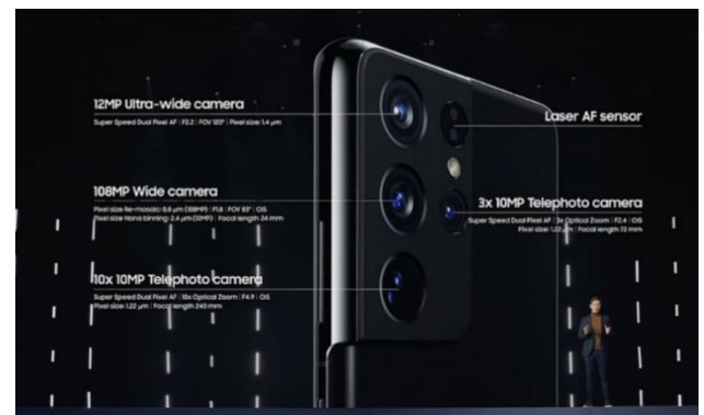
图 5：S21 Ultra 相机配置