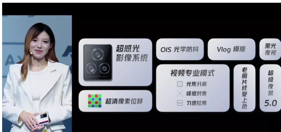
图 7: iQOO 7 影像能力一览

相机方面，iQOO 7 的后置三摄分别为 48MP 主摄、13MP 超广角、13MP 人像镜头。此外，主摄加入了 OIS 防抖功能，不管是拍照片还是视频，都更不容易糊了。iQOO 官方表示，iQOO 7 相机加入了 RAW HDR 2.0 算法，能提升画面解析力、更好地还原色彩等。随着短视频的蓬勃发展，vlog 拍摄已经成为很多消费者的刚需。这次 iQOO 7 把视频拍摄作为了手机影像的重点之一，手机中加入了“希区柯克变焦”等功能，让普通人也能拍出大片式的效果。同时，相机系统中也加入了多种 vlog 模板。