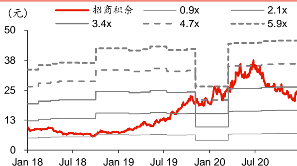
图表6: 招商积余历史 PB-Bands