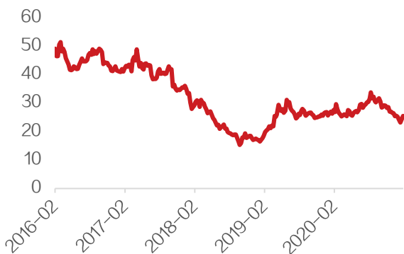
图 1：环保行业（申万环保）PE-TTM