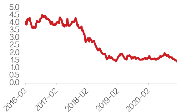
图 2：环保行业（申万环保）PB