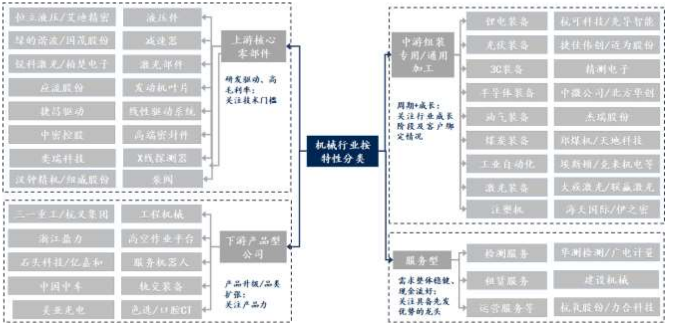
图 1：机械行业按特性分类及示例