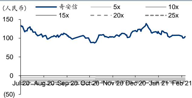
图表3: 奇安信 PE-Bands

可比公司采用 Wind 盈利预测一致预期, 股价为 2021 年 2 月 26 日收盘价