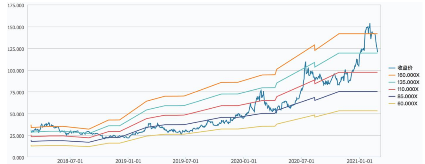
图 1：中科创达过去 3 年 PE-Band