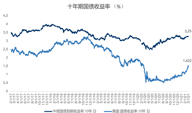
图 1: 十年期国债收益率