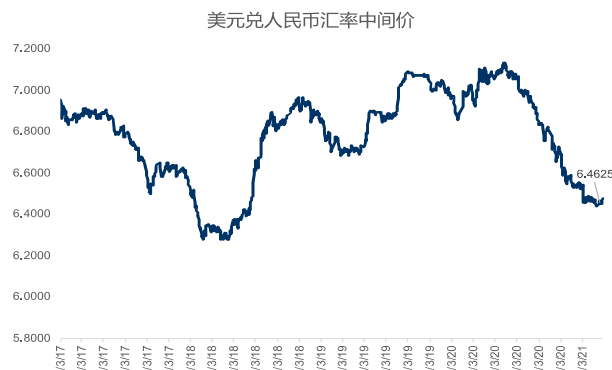
图 2: 人民币兑美元汇率