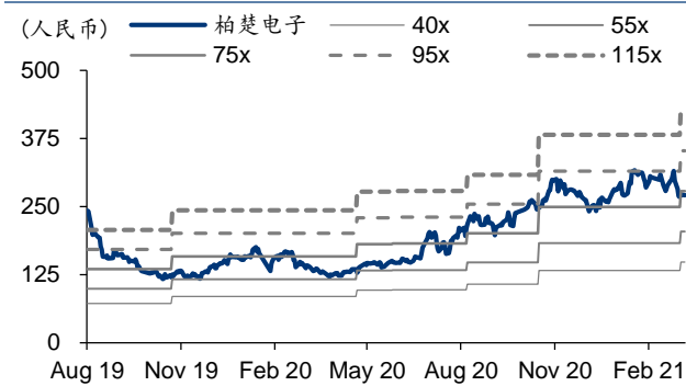
图表3: 柏楚电子 PE-Bands

可比公司采用 Wind 盈利预测一致预期, 股价为 2021 年 3 月 15 日收盘价