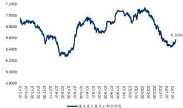
图 2: 人民币兑美元汇率