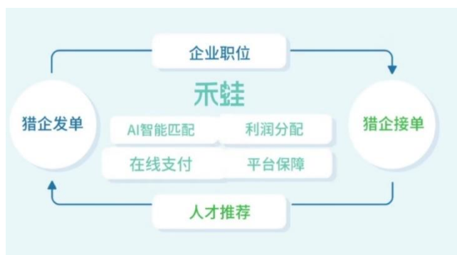
图 3: 禾蛙平台业务模式