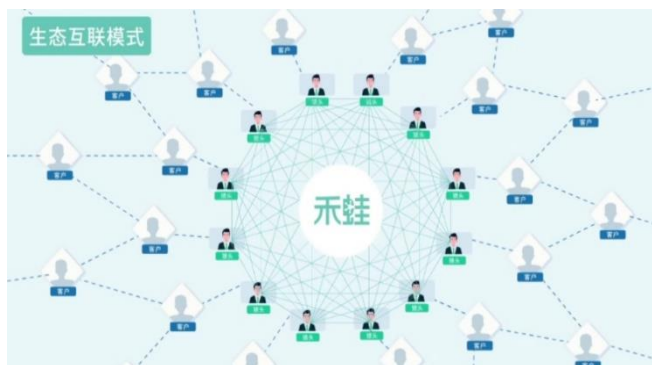
图 2: 禾蛙平台生态互联模式