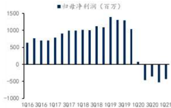
图 2：上海机场季度归母净利润