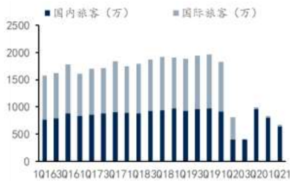
图 4：上海机场旅客吞吐量