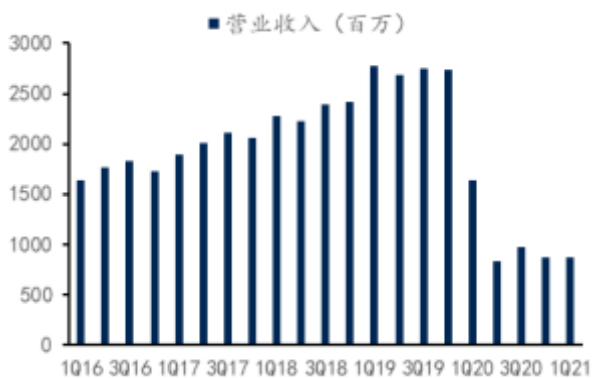
图 1：上海机场季度营业收入

上海机场披露一季报，营收 8.67 亿 (-47.1%)，归母净利润-4.36 亿。