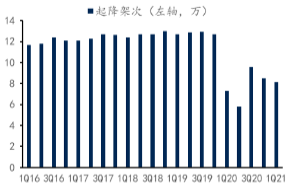
图 3：上海机场起降架次

一季度因就地过年政策影响，公司航班量 8.16 万，旅客吞吐量 668.4 万，环比 2020 年四季度有所下降。国门暂未开放，一季度公司国内客 31.5 万，环比四季度略降，免税收入确认 0.92 亿，收入承压。