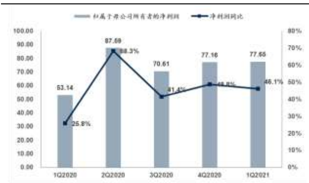
图 2：密尔克卫季度利润及增速（单位：百万、%）