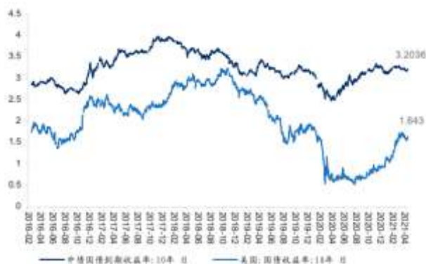
图 1: 十年期国债收益率