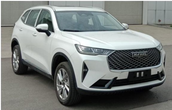
图 1：哈弗 H6 HEV 版外观

344 批《道路机动车辆生产企业及产品公告》中，长城汽车发布了 2 款 HEV 车型：哈弗 H6 HEV 版、WEY 拿铁 HEV 版。2 款车型均搭载了来自于宁德时代/比亚迪的电芯、150kw 的 1.5L 发动机，百公里油耗均为 4.9L。此前批次的工信部公告中，东风岚图 FREE 增程版、一汽红旗的部分车型亦有搭载比亚迪的动力电池。