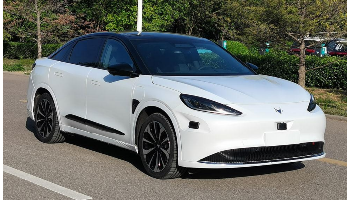
图 3: ARCFOX 阿尔法 S 华为 HI 版