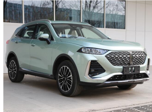
图 2：WEY 拿铁 HEV 版外观