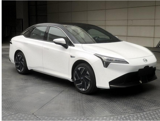
图 4: 新款埃安 S 外观