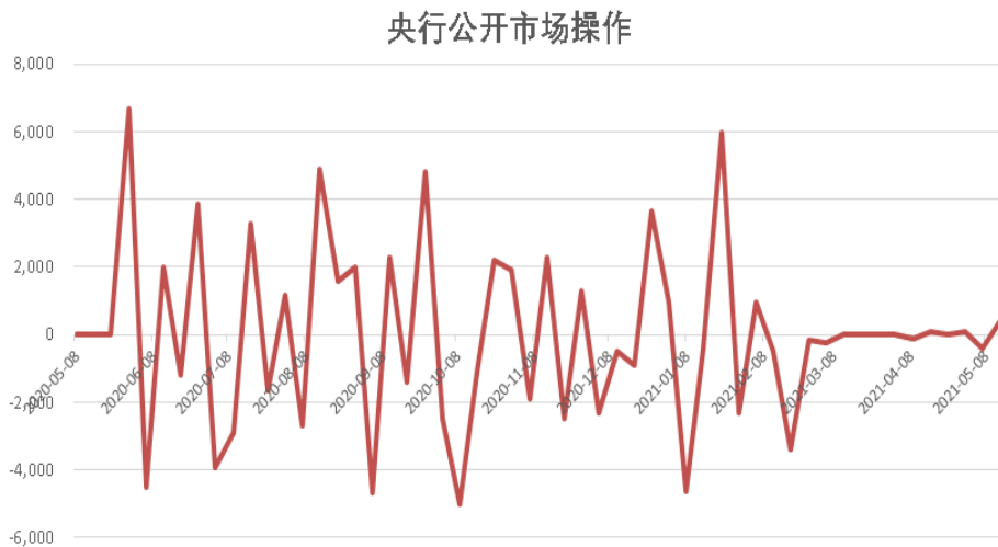
图表3: 上周央行通过公开市场操作净回笼100亿元 (单位: 亿元)