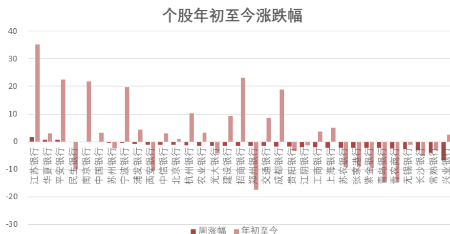
图表2: 上周银行板块大部分个股下跌 (单位: %)