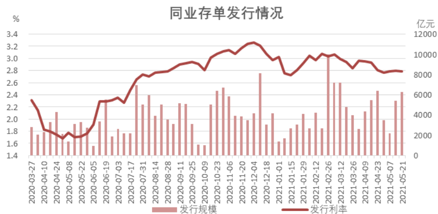
图表5: 同业存单实际发行规模6249亿元, 平均票面利率2.79%

上周, 同业存单实际发行规模6249亿元, 平均票面利率2.79%, 发行规模上升, 票面利率基本保持不变。