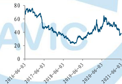
近五年电子(申万)行业 PE(TTM)