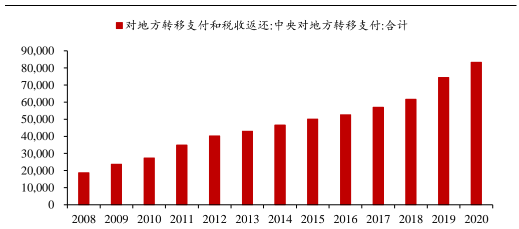
图 1：中央对地方的转移支付规模不断上升（单位：亿元）

随着 2020 年疫情的爆发，各地方政府财政收支进一步显著恶化，现有的转移支付机制的问题进一步暴露，疫情期间保就业、保民生、保市场主体的需求迫在眉睫，急需新的政策工具进行应对，特殊转移支付机制应运而生，我们认为中央向地方的财政资金“直达”有重要作用，可以有效补充最薄弱领域的财政资金支撑。