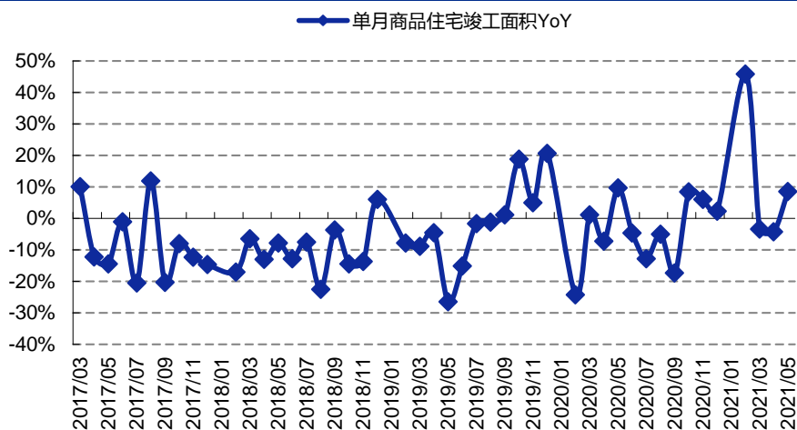
图 2：房地产住宅竣工增速