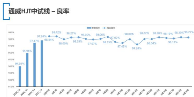
图 3：通威合肥 HJT 中试线良率达 98%