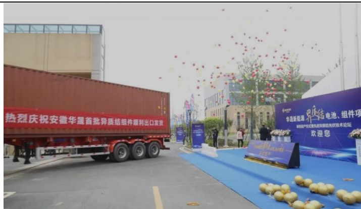
图 2：安徽华晟首批异质结组件已顺利出口发货