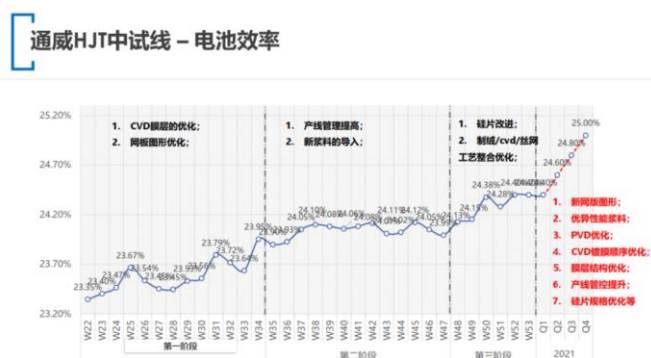
图 4：通威合肥 HJT 中试线转换效率达 24.3%