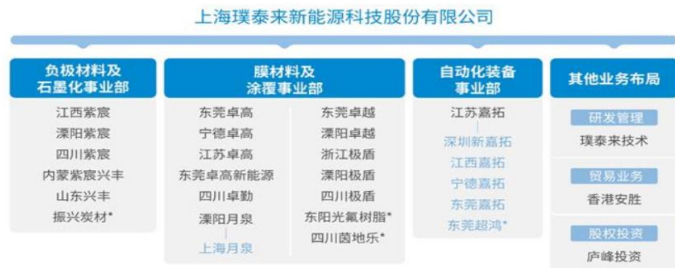
图 5: 公司新增隔膜、负极业务一体化布局

公司加大涂覆隔膜上游材料布局，进一步降低成本。 公司与东阳光合作开发 PVDF，与茵地乐联合研发水溶性粘结剂，实现重要涂覆材料及涂覆粘结剂的国产化替代，推动涂覆成本持续下行。涂覆材料方面，目前溧阳极盾涂覆材料纳米氧化铝及勃姆石二期产能建成投产，形成年产 5,500 吨纳米氧化铝及勃姆石产能，有效确保公司涂覆加工业务产品需求和海外客户的批量供应。此外公司子公司四川极盾启动 1000 吨的纳米氧化铝产能建设。公司形成涂覆材料 PVDF 及粘结剂改性 PAA 的稳定自给能力，继续推动 SBR 等其他粘结剂产品的布局，通过关键精细化工品的布局进一步保障锂离子电池客户在产品电化学性能及安全性的需求，进一步巩固提高公司涂覆隔膜加工业务的综合竞争力。