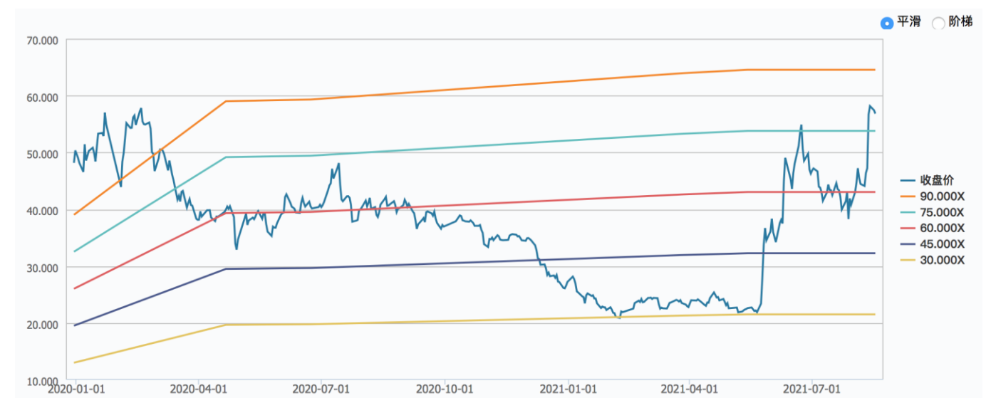
图 1：龙软科技上市以来 PE-Band