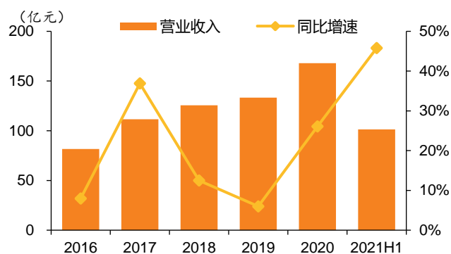
图 1：公司 2016-2021H1 营收及同比增速