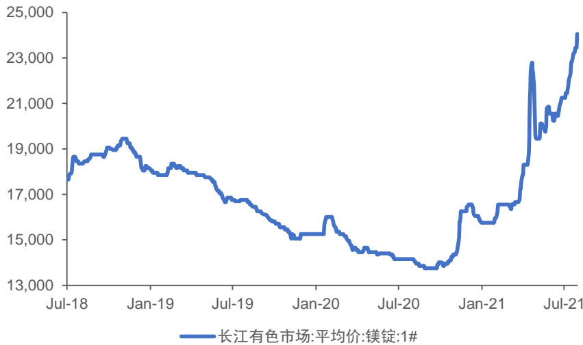
图表 1: 镁锭价格持续快速上涨