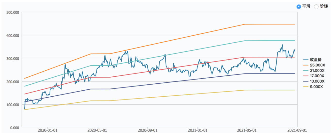
图 1：安恒信息上市以来 PS-Band