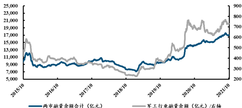
图表 5: 两市融资余额与军工融资余额走势情况

资料来源: Wind, 中航证券研究所整理 (数据截至 2021 年 10 月 22 日)