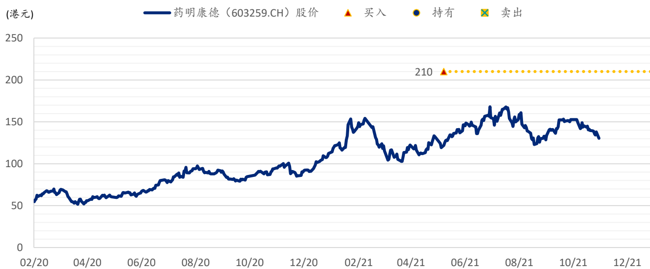
图表 3：浦银国际目标价：药明康德 A 股 (603259.CH)