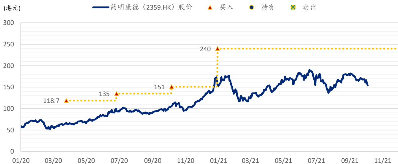
图表 4：浦银国际目标价：药明康德 H 股 (2359.HK)