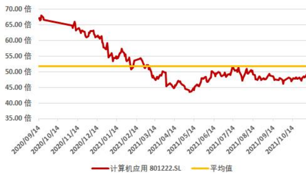
图 5：申万软件开发板块近一年市盈率水平（截至 2021 年 11 月 5 日）