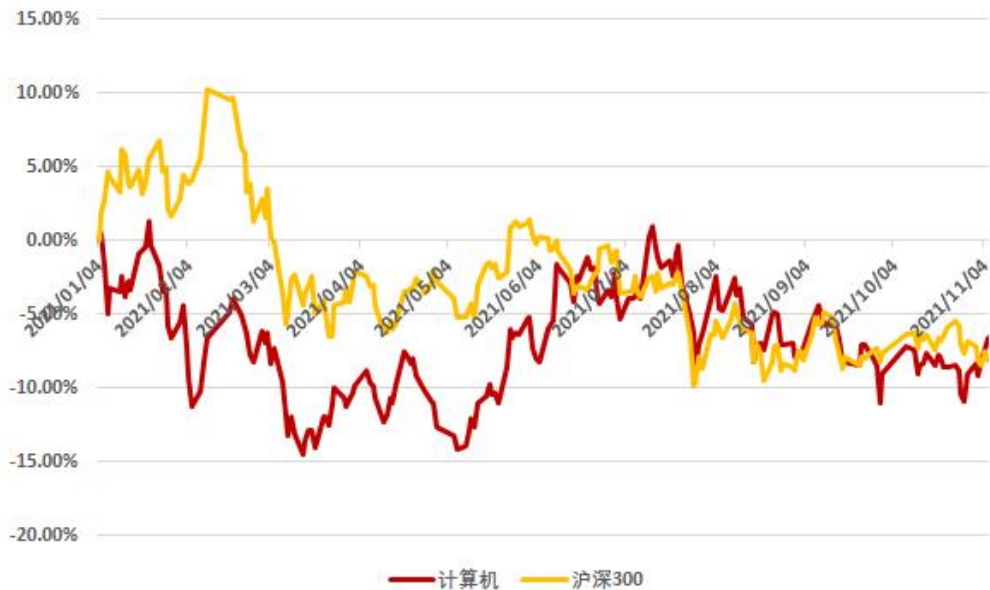
图 1：申万计算机板块年初至今行情走势（截至 2021 年 11 月 5 日）

本周（11/01-11/05）申万计算机行业上涨 2.79%，跑赢沪深 300 指数 4.15 个百分点，在申万 28 个行业中排名第 6 名；申万计算机板块 11 月累计上涨 2.79%，跑赢沪深 300 指数 4.15 个百分点，在申万 28 个行业中排名第 6 名；申万计算机板块年初至今下跌 4.72%，跑赢沪深 300 指数 2.36 个百分点，在申万 28 个行业中排名第 16 名。