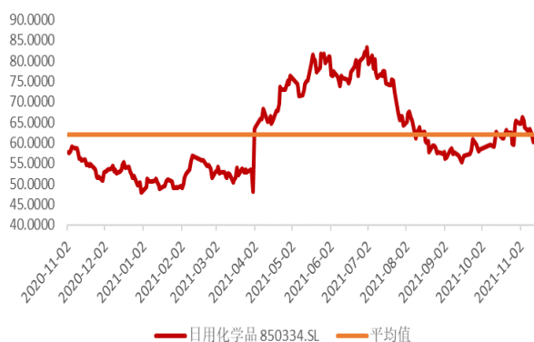
图3：申万日用化学产品行业PE（TTM，剔除负值，倍）