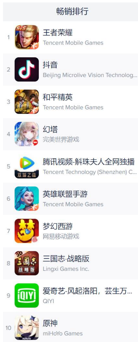
图表 4：上周中国 iOS 游戏 APP 畅销榜前十名（日）