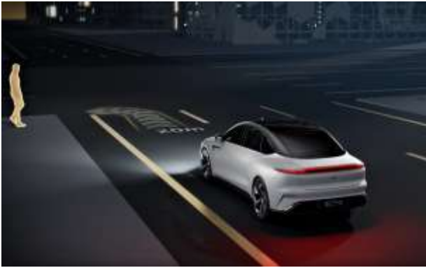
图 6: DLP 实现智能化导航指引