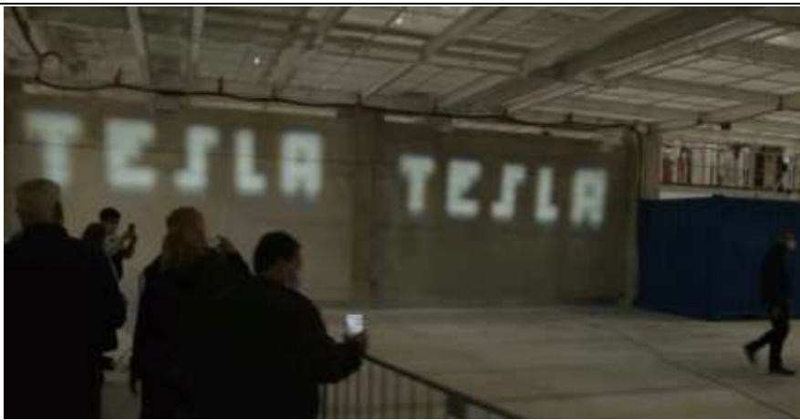
图 2：特斯拉柏林工厂 Model Y 车灯新技术展出

随着技术趋势不断演进，造车新势力的车灯配置强调科技、智能。特斯拉的横空出世，打造了全球智能电动车的理想范本，其上搭载的全景天幕、轿跑车身、中控大屏等元素均在新势力和传统车企上迅速得到追随应用，2021年10月在柏林工厂 Giga Fest 活动上，特斯拉展示了其新型的自适应前灯。该新前灯的 LED 矩阵的分辨率足够高，甚至可以在墙上显示出“TESLA”的标志。除此之外本款自适应大灯能够帮助驾驶员在在弯曲的道路上看得更清楚，并且不会影响迎面而来的车辆的行驶视野。