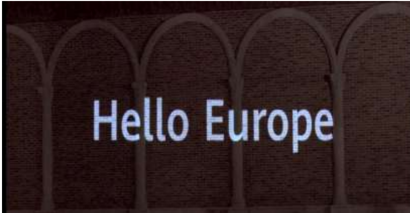
图 13: 华为在慕尼黑车展展示的“能放电影”的智能车灯投影