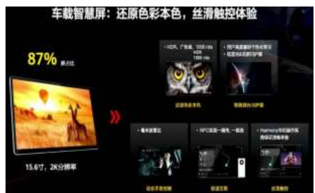
图 15: 华为车载智慧屏方案