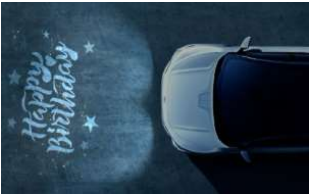
图 8: 智己汽车车灯投影