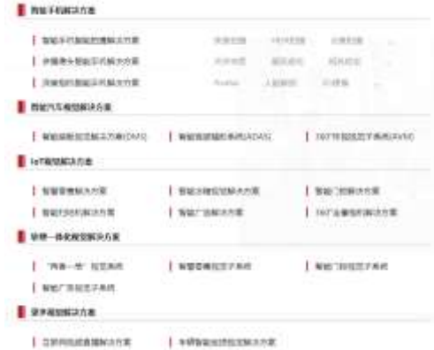
图 17: 虹软行业解决方案