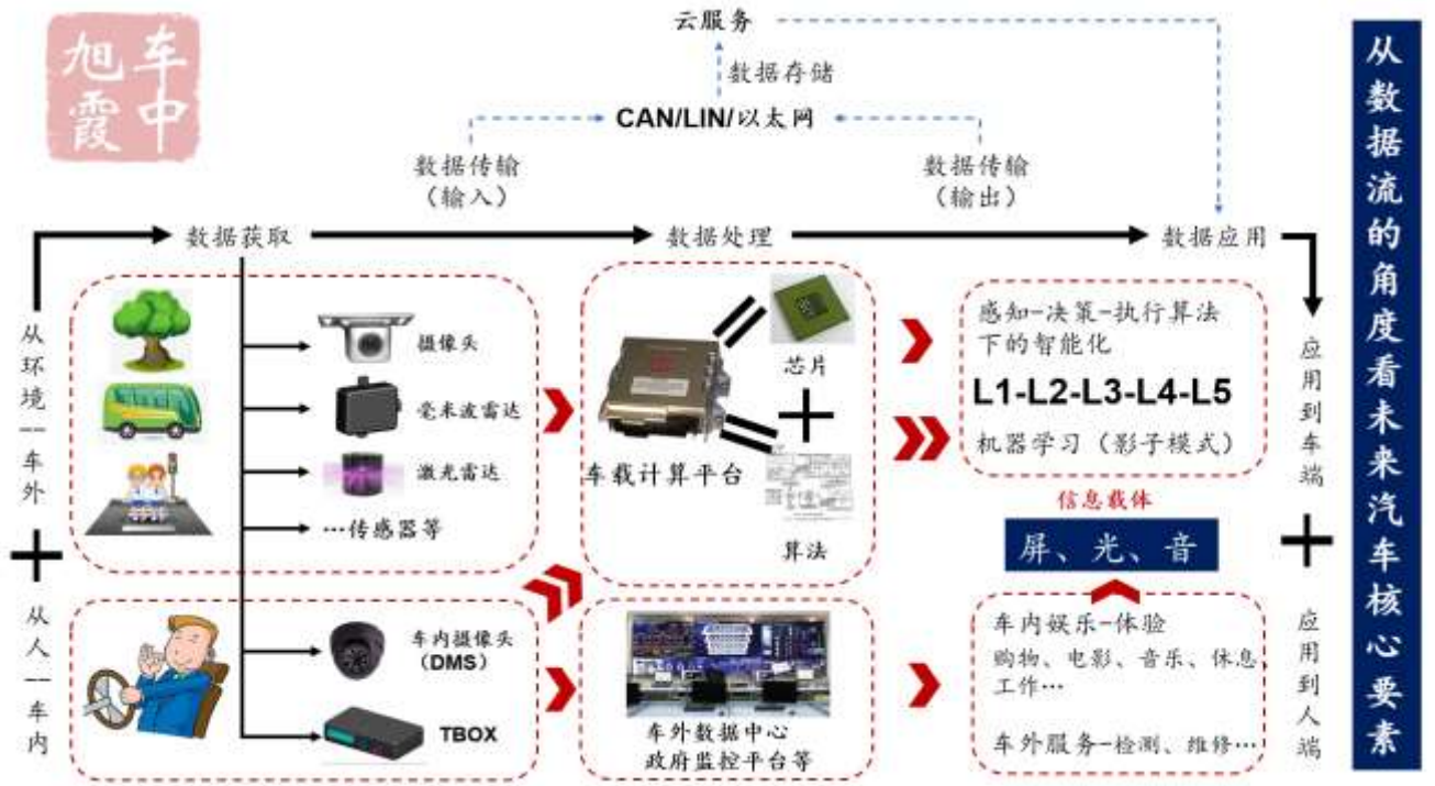
图 1：从数据流的角度挖掘未来汽车核心要素（车灯作为数据流输出端重要信息载体）

来智能化电动化背景下，车灯作为视觉件有望成为车辆数据流输出端的核心载体，实现从“照明”到“表达”的功能升级。