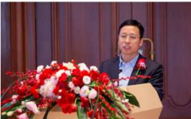
图 11: 华为光产品线总裁靳玉志先生致辞

星宇具备端到端定制开发生产能力及良好的市场基础。 星宇有着近三十年车灯行业经验, 具备端到端定制开发生产能力及良好的市场基础。此次合作意向书的签署, 是双方合作的重要里程碑, 依靠华为光产品核心技术及软件算法、平台化模块化的智能模组及控制器能力, 具备能打造智能车灯从设计到制造交付的系统级能力, 在业界形成持续领先的智能车灯竞争力。同时, 公司也开启与华为在智能车灯为代表的光产品线车载光产品的更多合作, 形成长期战略合作伙伴关系。