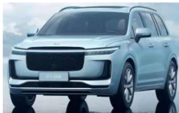
图 5: 理想 ONE 外观