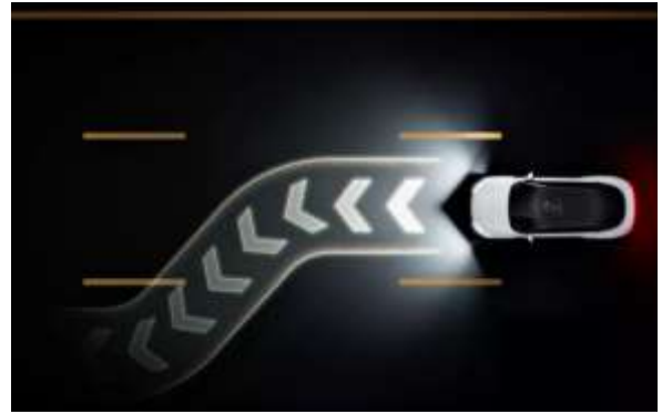
图 7: 智己汽车示宽光毯