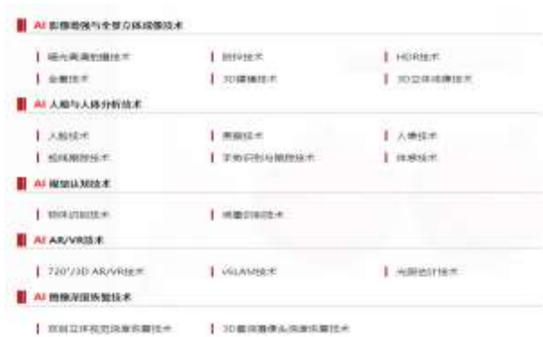
图 16: 虹软技术能力