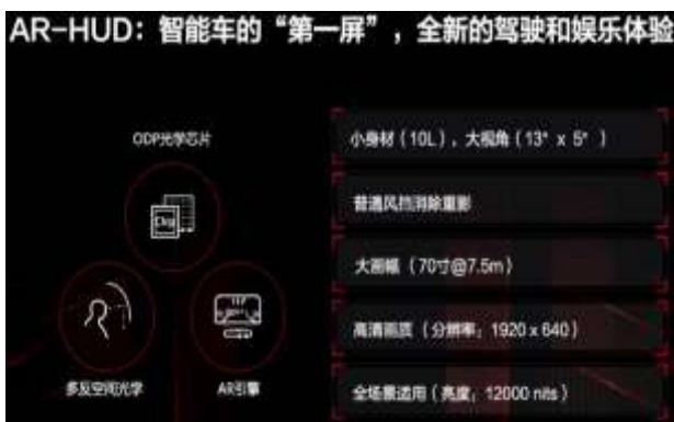
图 14: 华为 AR-HUD 方案