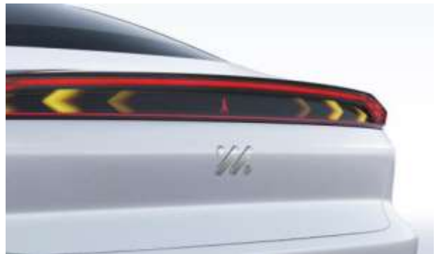
图 9: 智己汽车智慧灯光表达