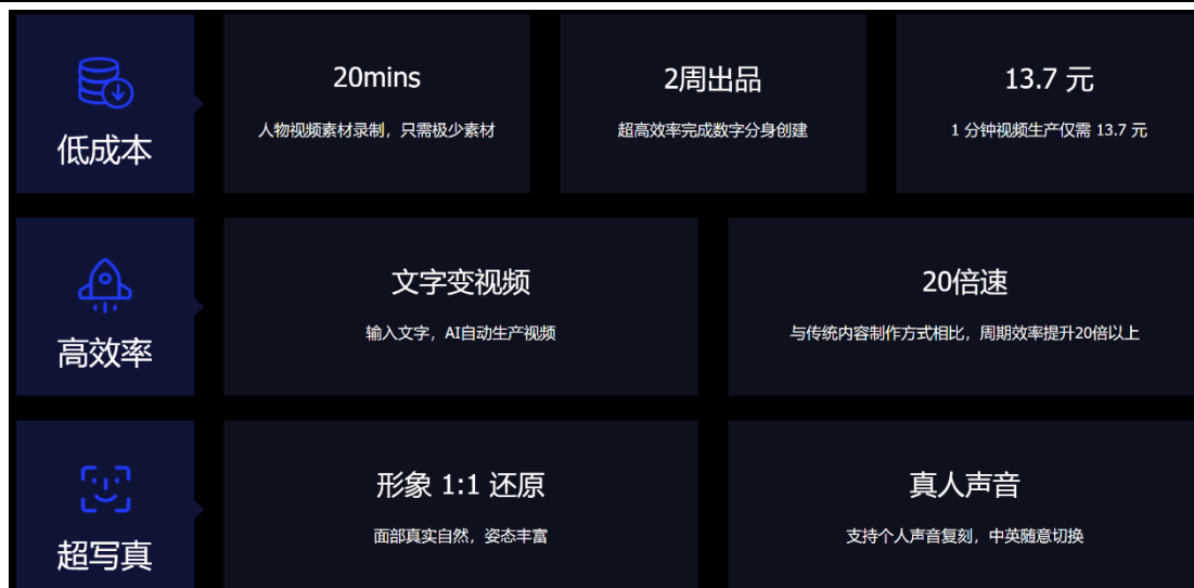
图 4: 分身有术数字人驱动平台

蓝色宇宙旗下分身有术平台，提供快速、低成本的“分享”解决方案，满足各行各业，各领域关键人的批量内容分享生产诉求，用20分钟视频创建1:1数字分身，14天训练模型，可完成输入文字生成视频，1分钟视频生产成本13.7元。