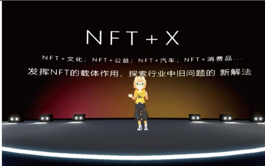
图 1: 数字藏品发行平台 MEME 发布会

2022年4月7日，蓝色光标集团孵化的首个数字藏品发行平台——MEME 魔因未来举办线上产品发布会，宣布 MEME 小程序上线及首期数字藏品发行项目，成立 BlueX 区块链实验室与 UDA 数字艺术家联盟。