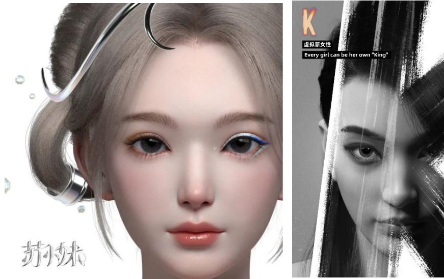
图 3: 虚拟数字人

2022年3月8日，蓝色光标旗下全资子公司蓝色宇宙发布全新虚拟人形象K，来自于元宇宙的虚拟音乐人。