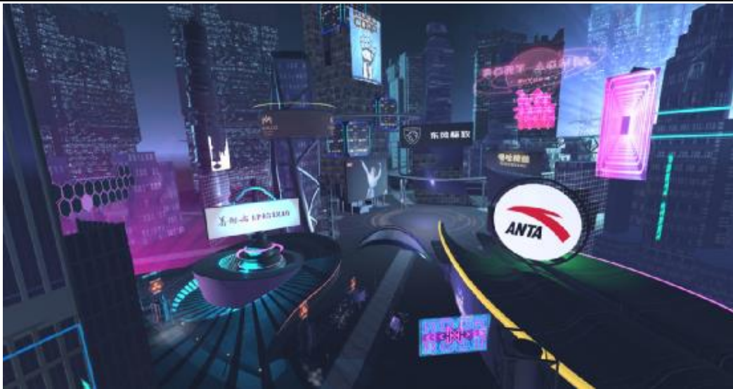
图 6: 蓝宇宙商业街区