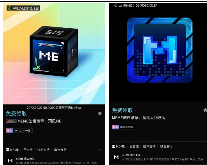
图 2: 数字藏品发行平台 MEME 首期产品

MEME 的首期发行项目“预见 ME”，以 16 型 MBTI 人格为原型，设计发行 16 款风格各异的 MEME 创世徽章，象征用户在 MEME 数字世界预知的另一个自己。MEME 今年已规划超 20 个发行项目，包括大众喜爱的品牌、名人名家、虚拟偶像、历史文化 IP 等。