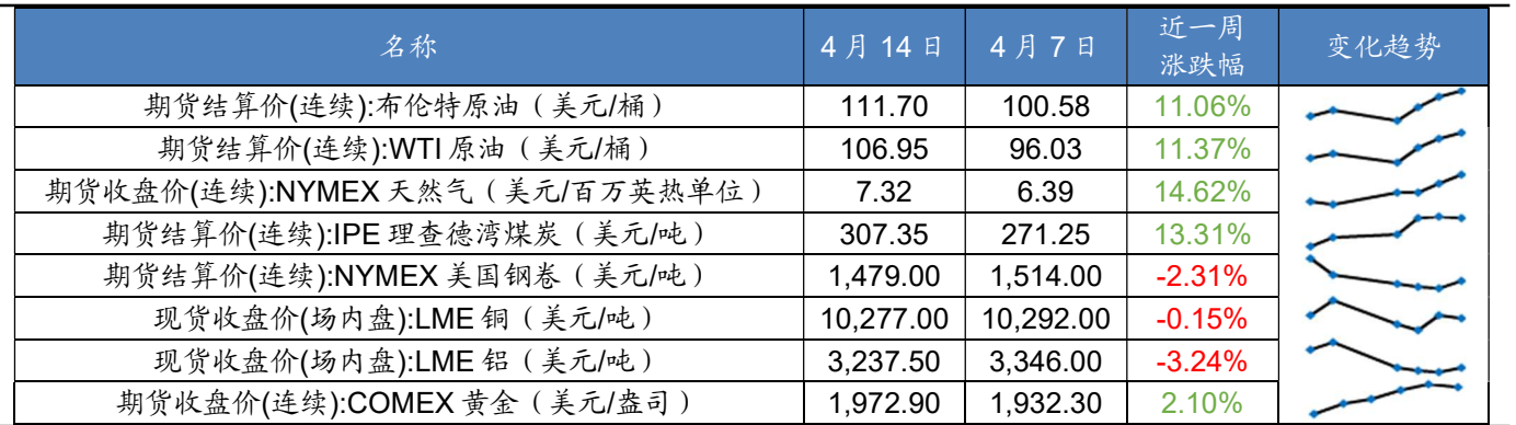
图表 8 2022 年 4 月第 3 周海外资产价格一览