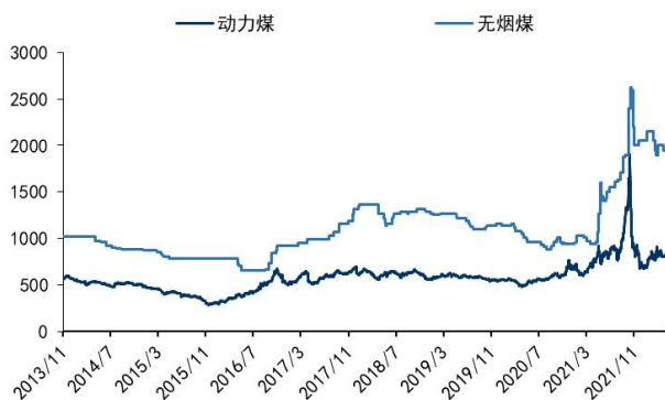
图3: 动力煤与无烟煤价格 (元/吨)