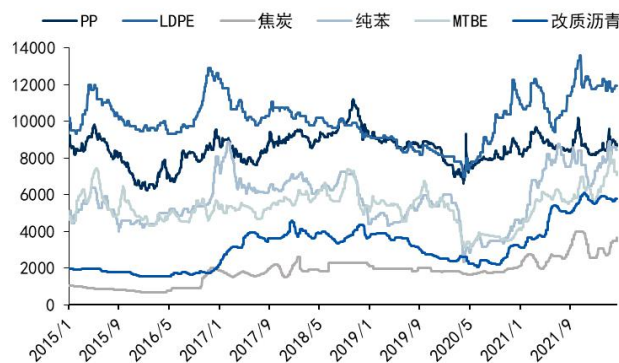
图4: 公司主营产品价格 (元/吨)