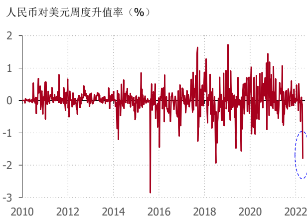
图表 1. 在2022年4月18-22日这周，人民币对美元贬值1.8%，创下2010年以来第三大单周贬值幅度

2022年4月下旬，人民币对美元贬值压力明显上升。在2022年4月18日至22日这周的5个工作日内，人民币对美元累计贬值1.8%，创下了2010年以来的第三大单周贬值幅度——前两大单周贬值幅度分别出现在2015年8月11日“811汇改”的这周（贬值2.8%），以及2018年6月的最后一周（贬值1.9%）。（图表1）