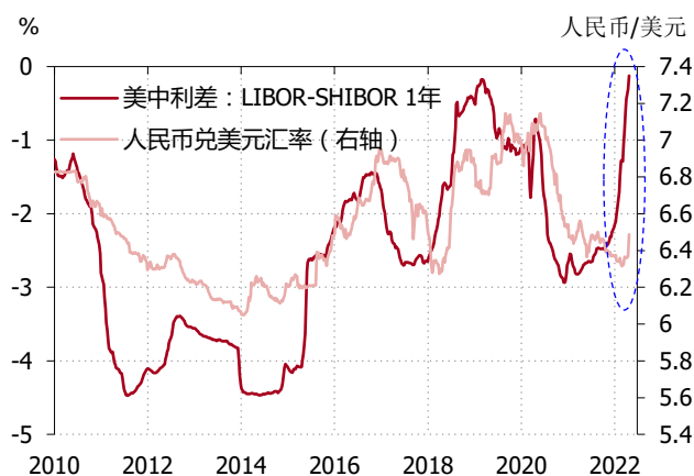
图表 2. 美中利差已显著上升，带来人民币贬值压力