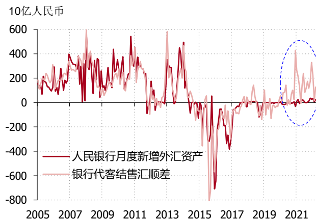
图表 6. 2020 年后人民银行退出了结汇售汇操作

这样一来，在新冠疫情爆发之后外汇因贸易顺差而大量流入的时候，国内外汇流出渠道并不顺畅，让外汇大量在国内堆积，因而降低了外汇市场中对美元的需求、增加了对人民币的需求，从而支撑了人民币汇率。过去大半年，原本同步变化的人民币兑美元汇率与美元指数之间之所以拉开了明显差距，主要原因就在于此。可以说，人民银行退出结汇售汇的行为阻塞了人民银行这个外汇流出的重要管道，让人民币汇率进入了更有韧性的新阶段。（图表 6）