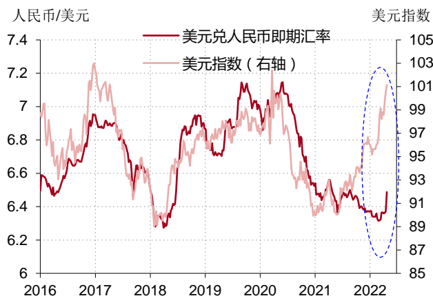
图表 3. 美元指数与人民币兑美元汇率之间已经拉出了很大裂口

但在最近 3 个季度，人民币兑美元汇率与美元指数走势显著背离。在 2021 年 5 月 28 日到 2022 年 4 月 22 日这段时间里，美元指数累计上涨 12.3%，但同期人民币却仅对美元累计贬值 1.9%——而且这贬值幅度几乎都发生在最近一周。如果过去几年美元指数与人民币汇率之间的相关数量关系仍然成立的话，人民币兑美元汇率应该在 7 左右，而不是现在的 6.5 附近。（图表 3）