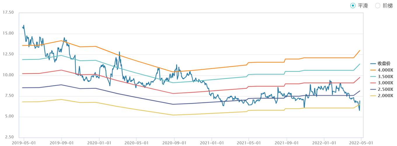
图 1：汉得信息过去 3 年 PS-Band