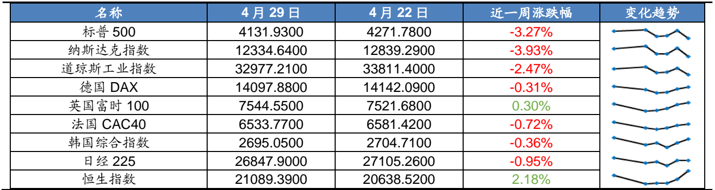
图表 7 2022 年 4 月第 5 周海外宏观股票指数一览