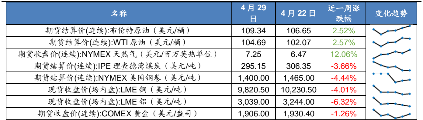
图表 8 2022 年 4 月第 5 周海外资产价格一览