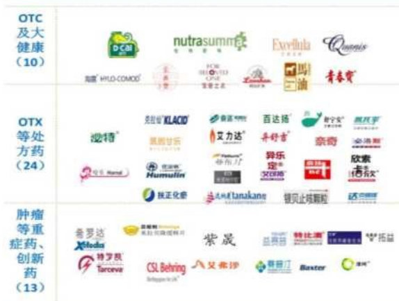
图表1：百洋品牌运营产品矩阵