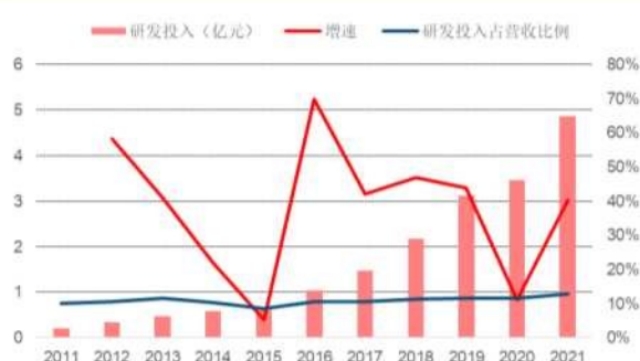
图表1： 2011-2021 年研发投入情况

2021 年公司研发投入为 4.86 亿元，占营业收入的 12.90%；2022 年一季度研发投入 1.04 亿，同比增长 16.3%，多年来安图研发投入均超过营业收入的 11%，2021 年更是高达 12.90%；公司不断吸纳优秀创新人才，目前研发人员已超过 1600 人，形成以郑州为中心，北京-上海-苏州-北美等为分支机构的研发体系。2021 年 7 月，公司推出了全自动核酸提纯及实时荧光 PCR 分析系统，创新性地实现了单个样本或小批量样本随来随检，提取、扩增全自动；2021 年 8 月，公司紧急推出“逆行者”核酸检测移动 P2+实验室，助力河南省抗击疫情。高端诊断仪器平台方面，高速化学发光仪已取得注册证，AutolasX-1 Series 已获一类备案凭证，目前处于转产试制阶段，下一代流水线系统、全自动高效液相色谱-三重四极杆质谱联用系统、高通量测序系统进入开发阶段。