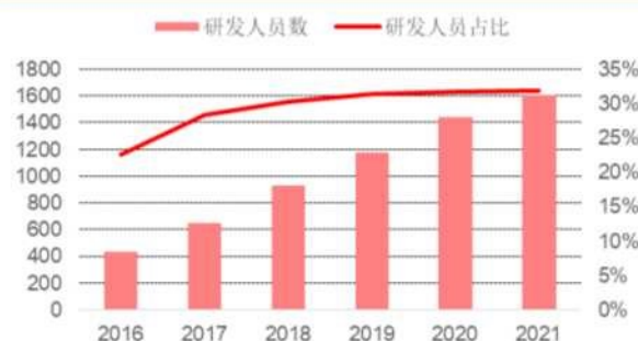
图表2： 2016-2021 年研发人员数及占比