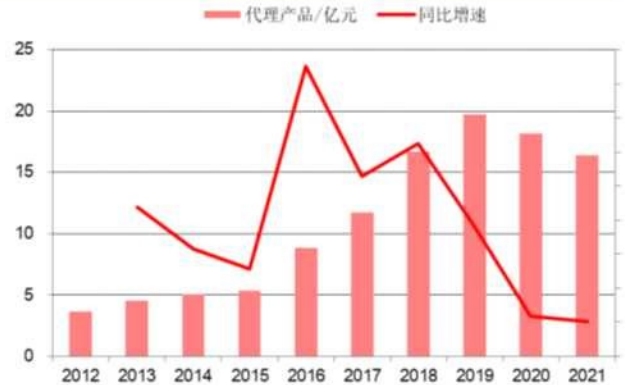
图表2： 2011-2021 年代理产品营收及增速