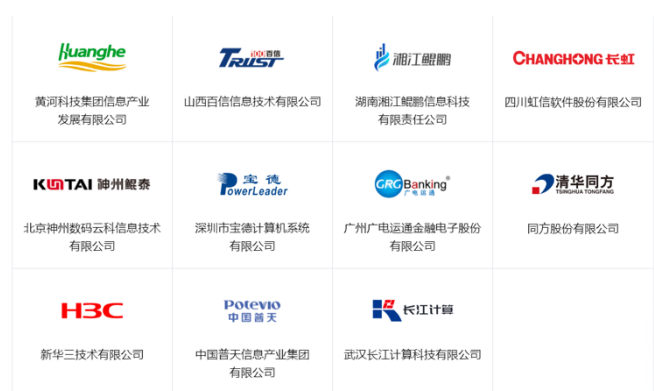
图 1：鲲鹏整机合作伙伴