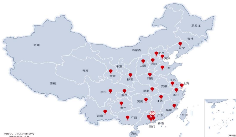
图 6：全国 24 地鲲鹏生态创新中心分布

多地生态创新中心落地，聚合合作伙伴实现信创加速发展。 鲲鹏在全国 24 地建立鲲鹏生态创新中心，鲲鹏生态创新中心是华为与各级政府在鲲鹏产业合作的载体，是华为在区域生态的抓手，未来有望通过多层次多方面的合作，实现信创产业的加速推进。