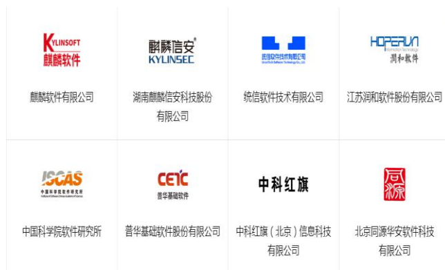
图 2：鲲鹏 openEuler 开源社区合作伙伴