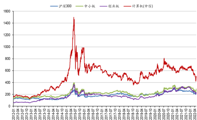
图8：计算机板块历史走势