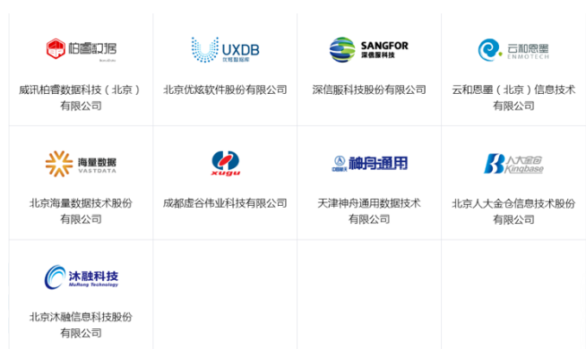
图 3：openGauss 开源社区合作伙伴