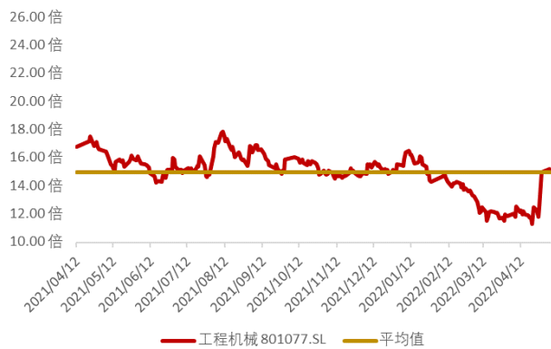
图 6: 申万工程机械板块近一年市盈率水平 (截至 2022 年 5 月 6 日)