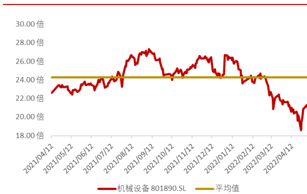
图 2：申万机械设备板块近一年市盈率水平（截至 2022 年 5 月 6 日）