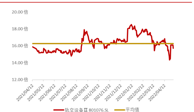
图 5：申万轨道交通板块近一年市盈率水平（截至 2022 年 5 月 6 日）