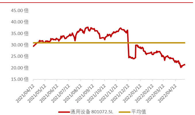
图 3：申万通用设备板块近一年市盈率水平（截至 2022 年 5 月 6 日）