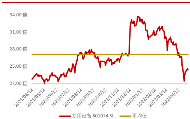
图 4：申万专用设备板块近一年市盈率水平（截至 2022 年 5 月 6 日）