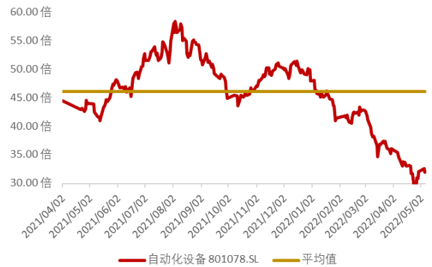
图 7: 申万自动化设备板块近一年市盈率水平 (截至 2022 年 5 月 6 日)