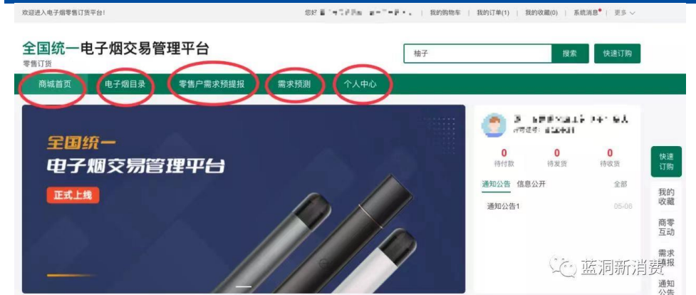
图 2. 全国统一电子烟交易管理界面