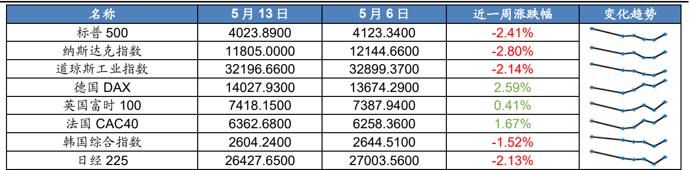
图表 7 2022 年 5 月第 2 周海外宏观股票指数一览