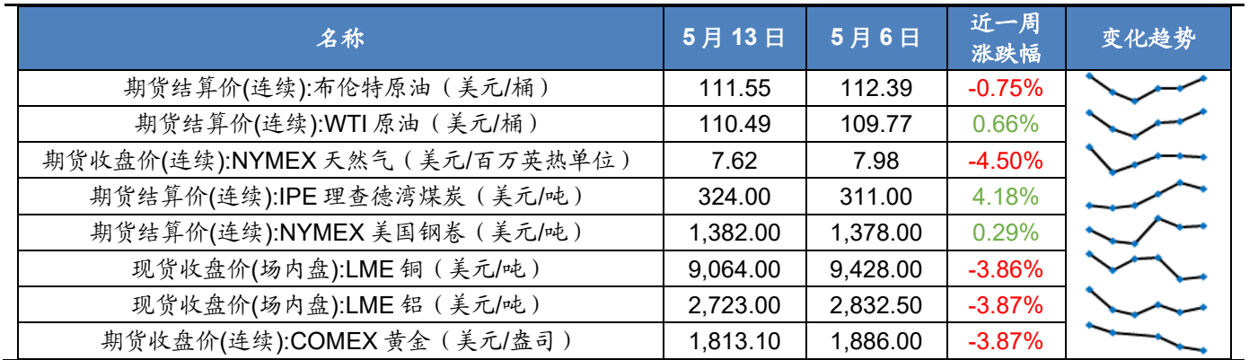
图表 8 2022 年 5 月第 2 周海外资产价格一览