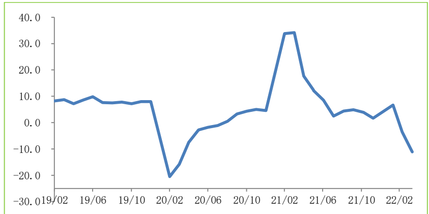
图 2：中国零售销售增长（%）

亦低于市场预期的 6.6%跌幅，主要因为新冠疫情多地爆发、居民收入增长疲弱以及居民消费意愿不高（图 2）。根据我部的测算，撇除价格因素，4 月份消费品零售实际增速亦由 3 月的-6.0%大幅回落至 -14.0%。4 月份餐饮收入同比下跌 22.7%，反映疫情严重冲击了居民外出用餐。产品消费方面，生活必需品消费仍维持较快增长，4 月份粮油与食品类和饮料类消费分别同比增长 10.0%和 6.0%。油价上涨亦带动 4 月石油及制品类消费同比增长 4.7%。4 月消费增速较慢的产品包括金银珠宝类、汽车类、化妆品类与通讯器材类等可选消费品，分别同比下跌 26.7%、31.6%、22.3%以及 21.8%。此外，首 4 个月全国网上零售额同比增长 3.0%，比首 3 月增速回落 3.6 个百分点。