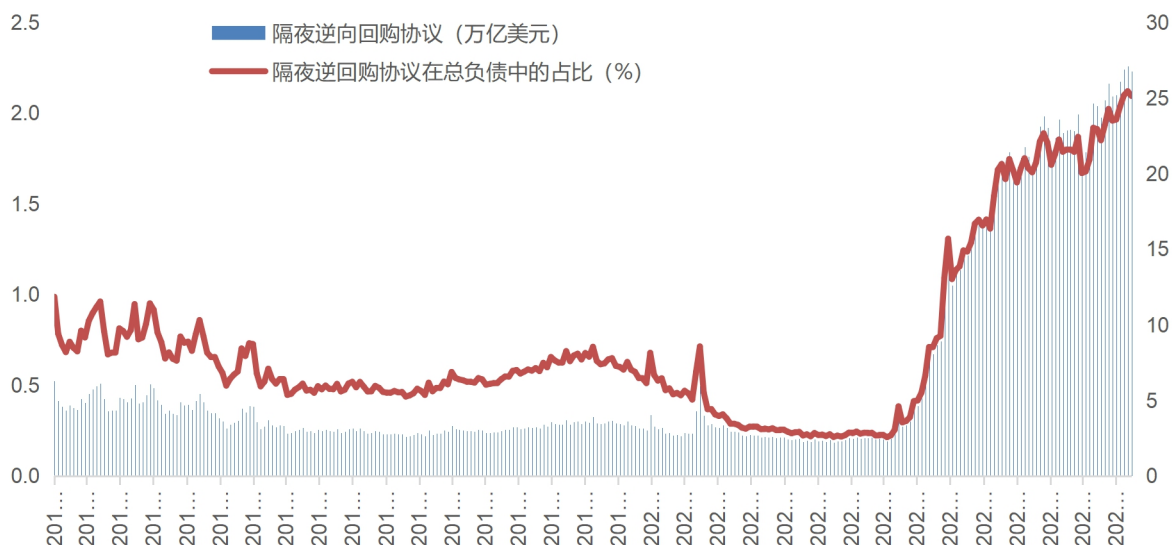
图 2 2021 年后美国隔夜逆回购协议规模快速攀升