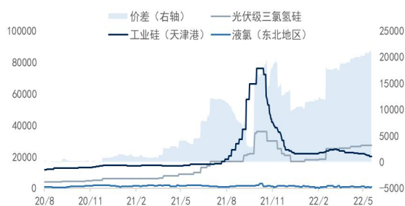
图2: 光伏级三氯氢硅价格与价差 (元/吨)