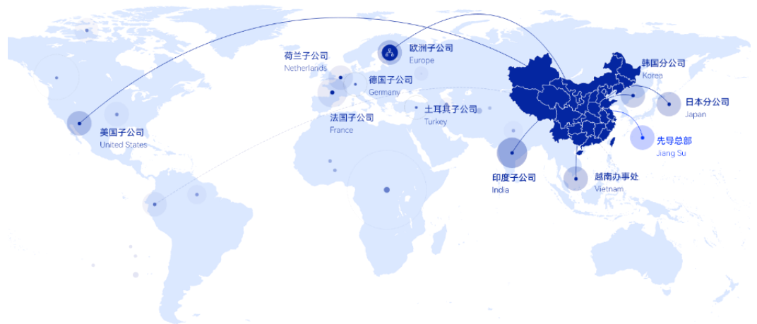
图2：先导智能在全球多地均设置子公司

先导智能在欧洲多点布局，本土团队已达到 100 余人，长期固定服务于海外客户的工程师团队达 1100 余人，公司搭建了成熟的欧洲本地供应链体系，与西门子，ABB，Festo 等多家核心供应商形成战略合作。我们认为国内头部设备商具备全球竞争力，随着锂电设备商积极进行海外布局，将充分受益于海外电池厂相较国内偏滞后的大规模扩产，模式可能为前期建设研发中心、中期建设售后服务点、远期建设组装厂。