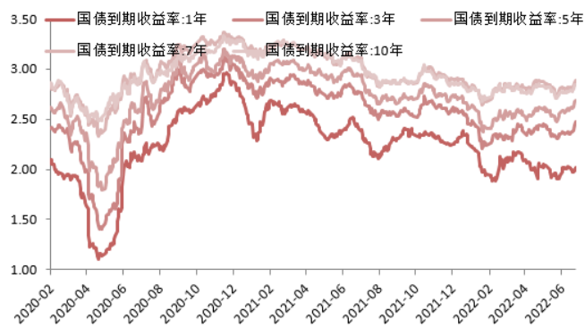
图 2:国债收益率曲线和每日变动