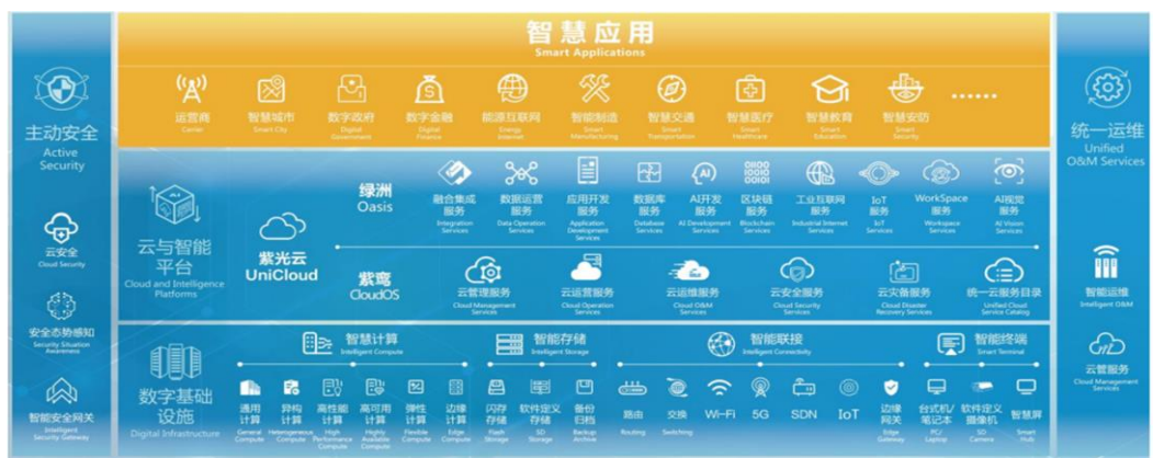
图 2：新华三全线产品

数字经济已成为当前经济发展关键支撑，ICT 设备为支撑企业数智化转型的核心基石，长期受益于数字化时代的发展。公司围绕“数字大脑”智能战略，通过两大主营业务和五大核心子公司实现“芯—云—网—边—端”全产业链深度布局： 1) 芯片 ：新华三半导体自研高端网络设备芯片，驱动盈利能力持续提升； 2) 云计算 ：新华三与紫光云提供公有云、私有云、混合云多重解决方案，实现云计算产品全线覆盖； 3) 网络和 IT 设备 ：公司在交换机、路由器、服务器等领域均具备核心竞争力，随着华为向纯软聚焦，公司市场份额有望持续提升； 4) 网络安全 ：国家重视网络安全发展，公司网安竞争实力强劲； 5) 商用终端 ：践行“AI in All”智能战略，致力于构建全场景的数字赋能链路。